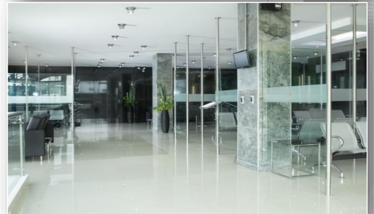
Manizales – Cra 25 No 47 - 05