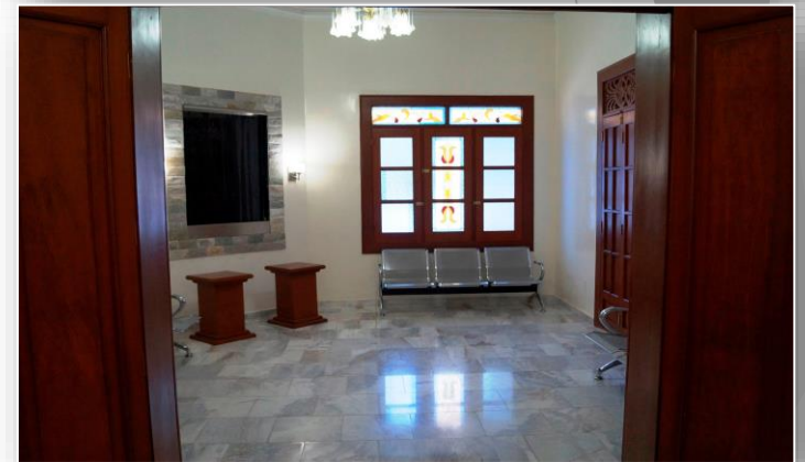
Barranquilla – Cra. 53 No 59 – 55