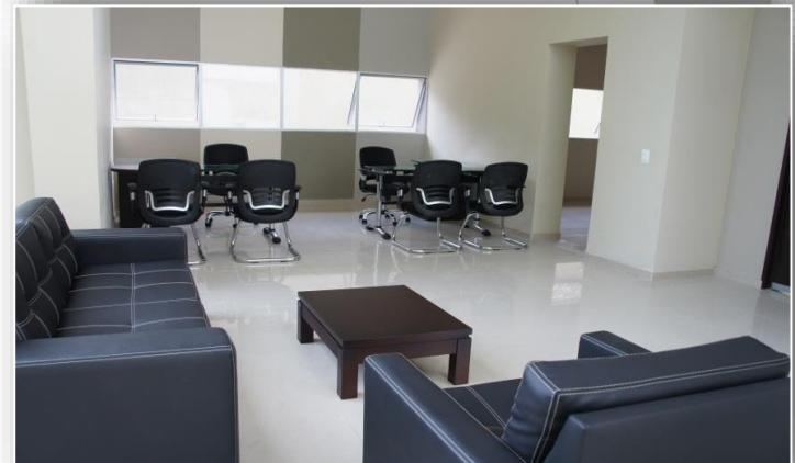
Leticia – Av. Vásquez Cobo Cra 10 No 15- 75