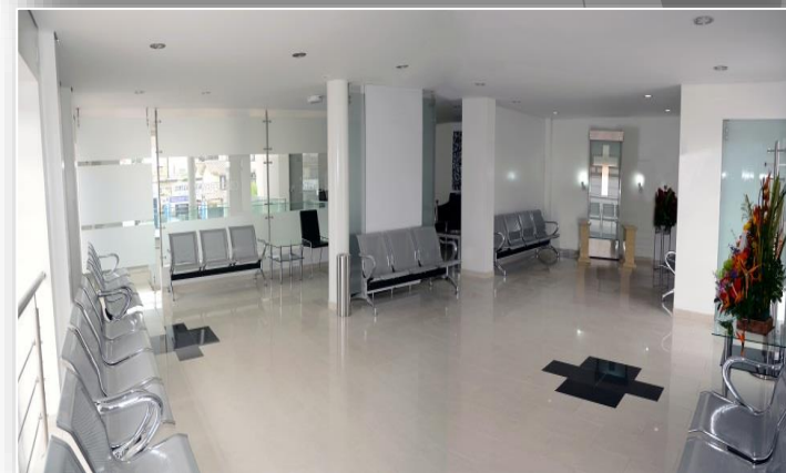
Chía – Cll. 2 No 5 A - 27