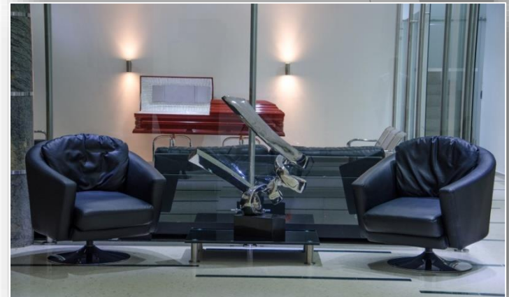
Cali – Cll. 5 No 38 A - 28