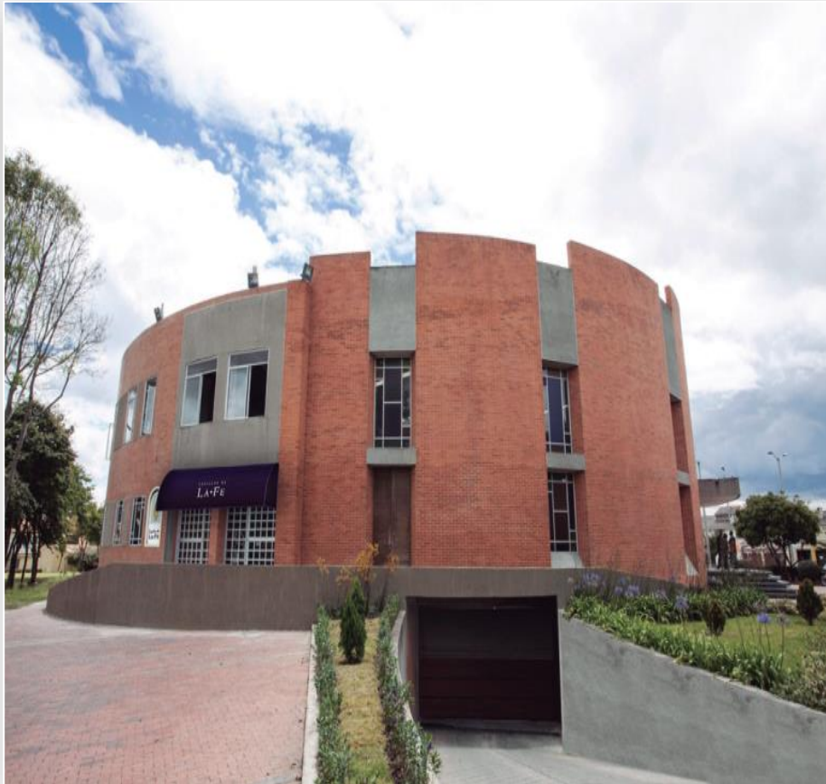
Bogotá D.C. – Cra 19 No 154 - 76