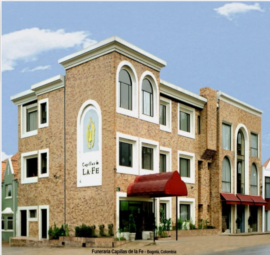
Funeraria Capillas de la Fe - Bogotá, Colombia